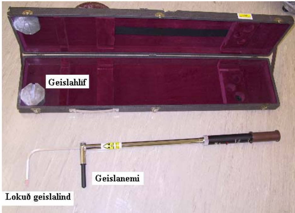
Mynd 2: Færanlegur áfyllingarmælir (geislagaffall) í geymslu hjá Geislavörnum ríkisins. Í þessum geislagaffli er geislavirka efnið ^{137}\text{Cs} .

geislavirka efnið sé ^{60}\text{Co} með virkni um 20 MBq. Helmingunartími ^{60}\text{Co} er aðeins um 5 ár og líftími geislalindar er því skammur.